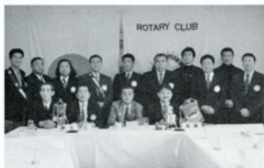
11月22日 野崎ガバナー公式訪問