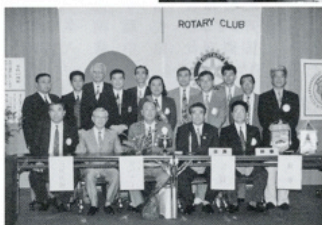
8月20日 岸ガバナー公式訪問