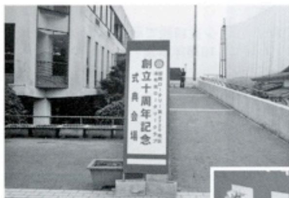
式典会場の中央公民館