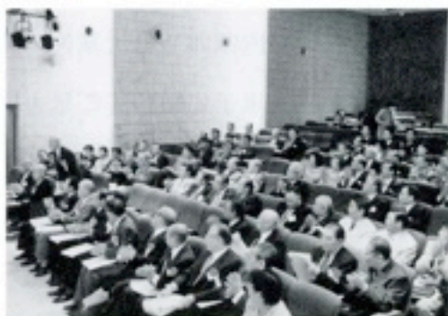
創立10周年に参加下さった各位