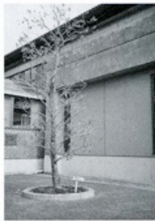
4周年：湯布院中学校 「クロガネモチ」