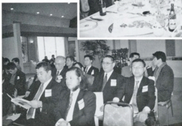
2月19日 大分県 I.M 杉乃井ホテル