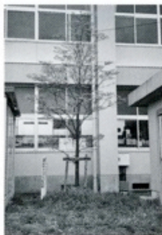
6周年：塚原小学校 「花水木」