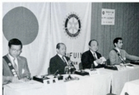
9月26日 伊東ガバナー公式訪問