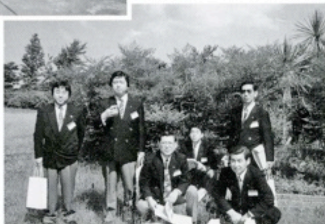
5月24日 地区協議会：八代市