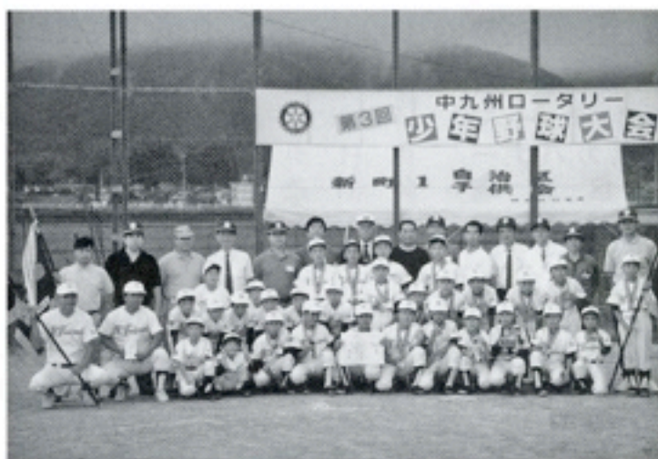
8月27日 第3回中九州ロータリー 少年野球大会ホスト