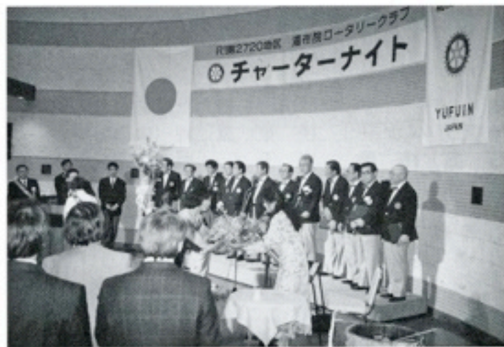
友情出演による 別府ロータリーコール の皆様