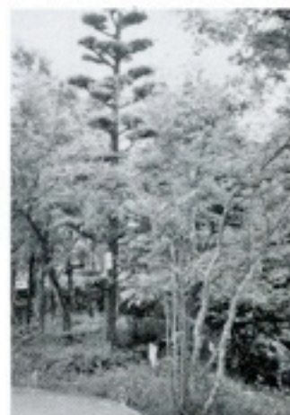
2周年：温泉館 「ヒマラヤスギ」