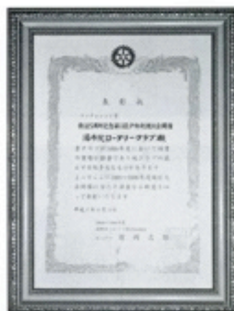
ワンチャレンジ賞