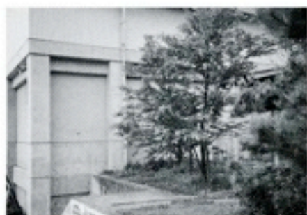
5周年：川西小学校「桜」5本