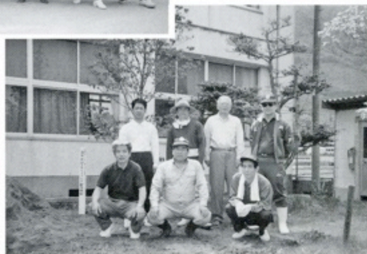
6月3日 創立6周年記念植樹 塚原小学校 「花水木」植樹