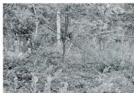
9周年：西石松 「ほたる池と山モミジ」