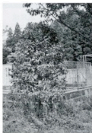
7周年：湯平小学校 「山ツバキ」

※田北ガバナー年度（3年次）より 取り組んできた“ほたるの里” づくり。 9年次に養殖池（ほたる池）の 完成。 10年次にはほたるが飛び交うま でになりました。