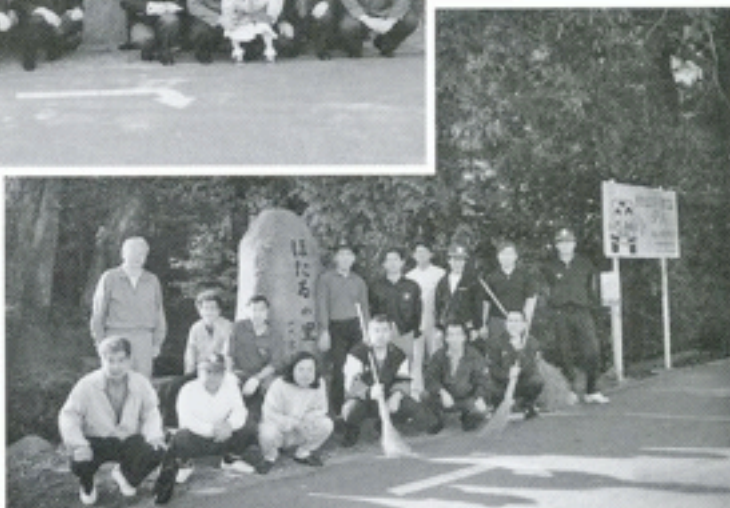
5月23日 ほたるの里 石碑周辺清掃奉仕