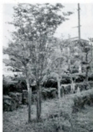
8周年：中央児童公園 「山ボウシ」