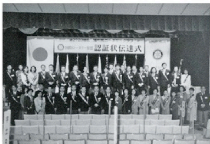
H4.4月18日 認証状伝達式