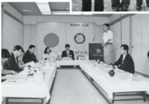
座っての例会風景：大翔館