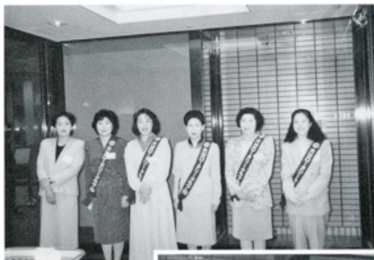
当日お手伝いいた だいた御婦人の方々