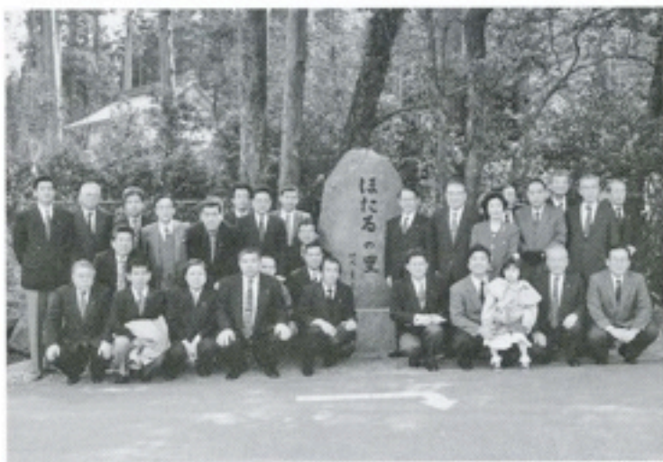
3月18日 「ほたるの里」の石碑 除幕式