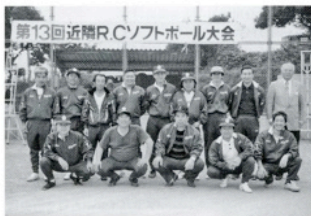
9月29日 近隣7RCソフトボール大会 準優勝