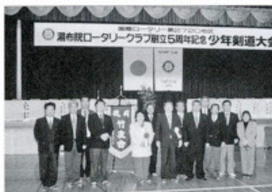
創立記念剣道大会（3月10日） 前岡ガバナー夫妻をお迎えして