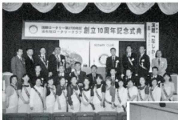
少数精鋭で頑張った 10周年事業