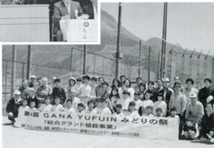
4月29日 ガナ：みどりの祭参加