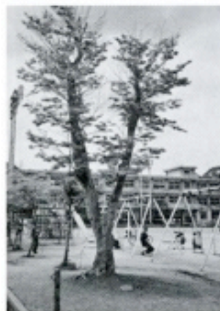
3周年：由布院小学校 「山モミジ」