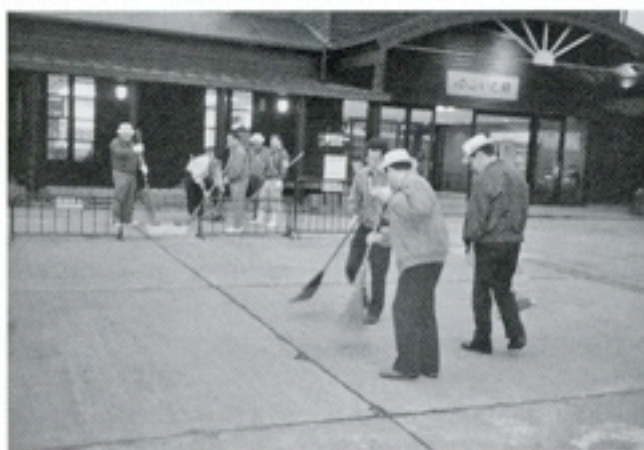
10月31日 ゆふいん驛舎 クラブ初めての清掃奉仕