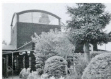
創立記念：ゆふいん駅「山モミジ」 初代は残念なことに枯れてしまい、 現在は2代目が植えられている。