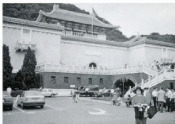
6月12日～17日 クラブより国際大会（台北） 参加第一号 （吉村幸治バスト会長夫妻）